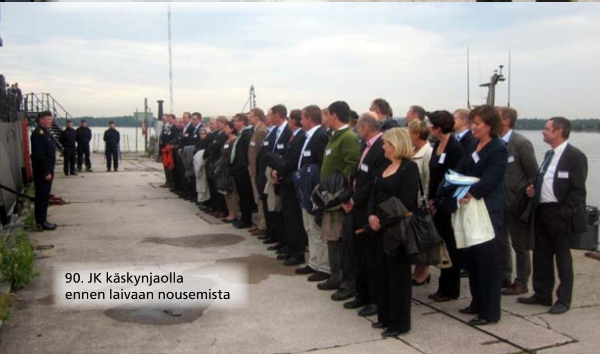
90. JK käskynjaolla ennen laivaan nousemista