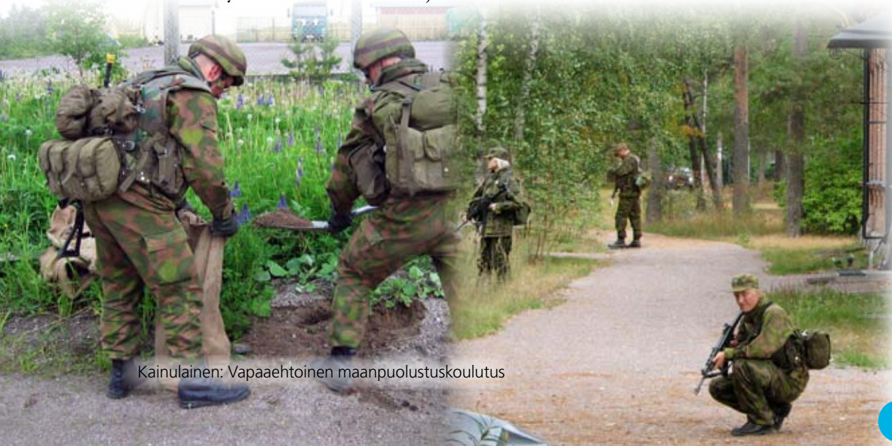
Kainulainen: Vapaaehtoinen maanpuolustuskoulutus

Puolustusvoimauudistuksessa todennäköisesti vähenevät sijoitetun reservin määrä sekä kertausharjoitukset. Nämä toimenpiteet heikentävät puolustuksen perustana olevan asevelvollisuusarmeijan toimintakykyä. Muutoksilla ei tule olemaan myönteistä vaikutusta reserviläisten maanpuolustustahtoon ellei vapautuvalle reserville pystytä osoittamaan mielekkäitä tehtäviä kokonaisturvallisuuden kehittämisessä. Suomen puolustus rakentuu loppujen lopuksi osaavan ja motivoituneen reservin varaan. 🌐