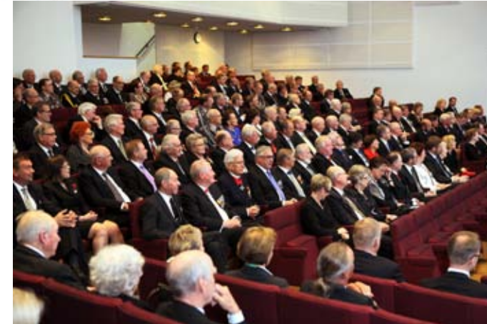
Luottamusjohdon tilaisuus pidettiin Helsinki-salissa ennen pääjuhlaa