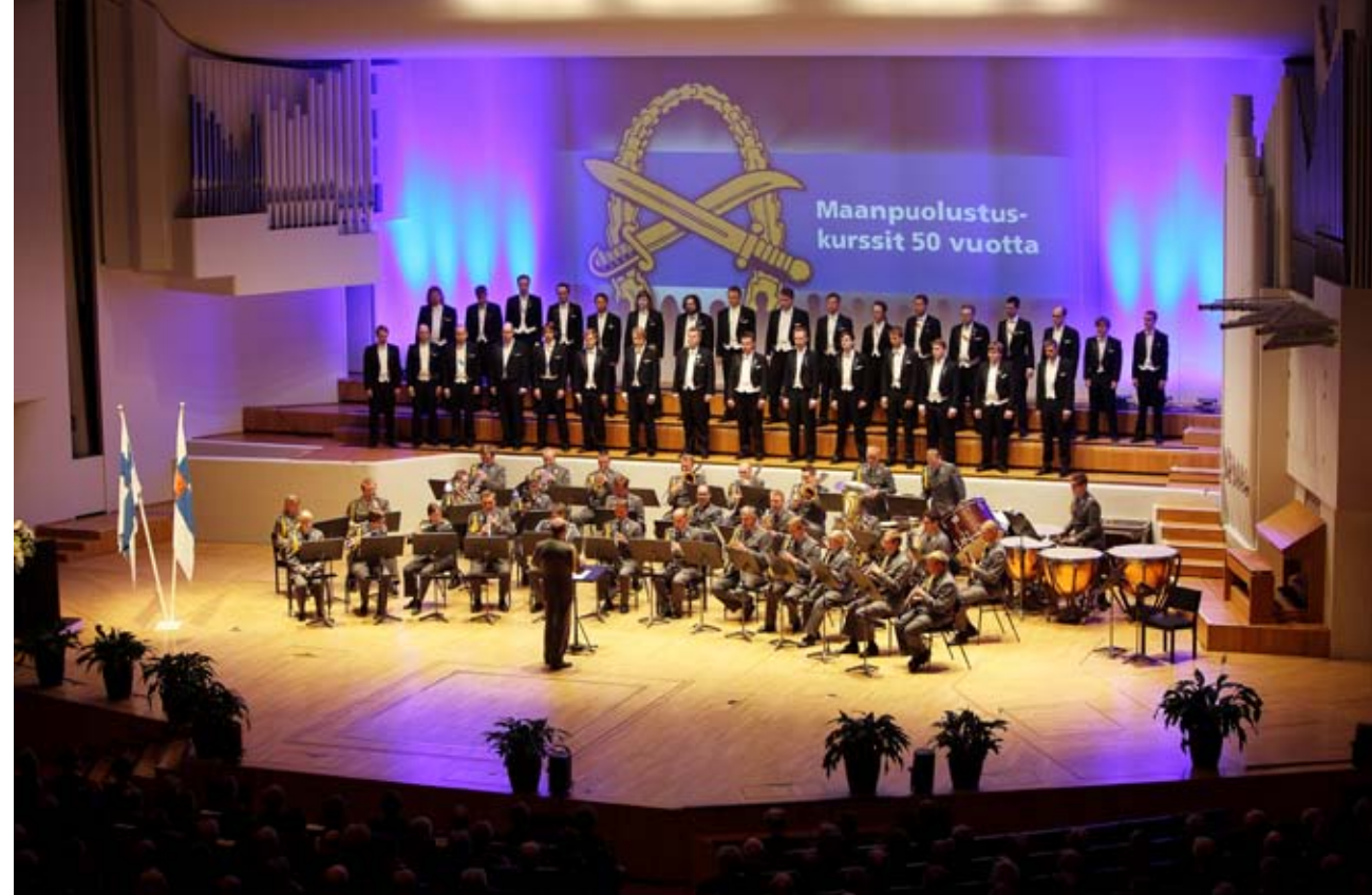
Päiväjuhlassa esiintyivät Kaartin Soittokunta sekä Ylioppilaskunnan Laulajat. Juhlan lopussa nämä esittivät yhdessä Sibeliuksen Finlandian ennen juhlan päättänyttä Maamme-laulua

Vaikka muoto on lähes sama, muuttuvan tekijän kursseilla muodostaa reagointi kulloiseenkin kansainväliseen ja turvallisuuspoliittiseen tilanteeseen; aluksi kylmän sodan tai ”kylmän rauhan” maailma, Suomen erityissuhde Neuvostoliittoon sekä Pohjois-Euroopan ja Itämeren alueen turvallisuus- ja puolustuspoliittinen tilanne, Lähi-itä ja muut maailman kriisipesäkkeet. Merkittävä murroskohta – ja samalla poikkeuksellisen intensiteetin aika maanpuolustuskurssiopetuksessa – sijoittui 1990-luvulle, Neuvostoliiton romahdukseen ja Euroopan integraation sekä Balkanin sotaan.