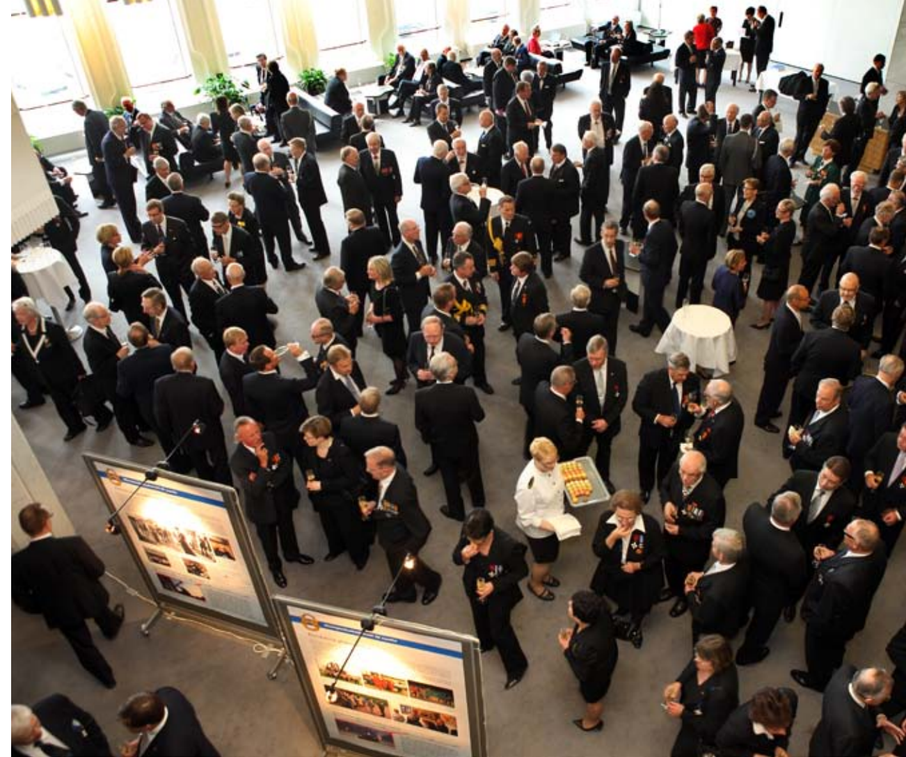
Päiväjuhlan yleisöä odottamassa juhlan alkua Finlandia-talon lämpiössä

Valtakunnalliset ja myös alueelliset maanpuolustuskurssit ovat yksi hyvä tapa vahvistaa kansalaisten verkottumista ja kriisivalmiuksia. Lisäksi asevelvollisuuden ja siviilipalveluksen kautta voidaan vaikuttaa nuorten kuvaan siitä, minkälainen on se yhteiskunta, jonka