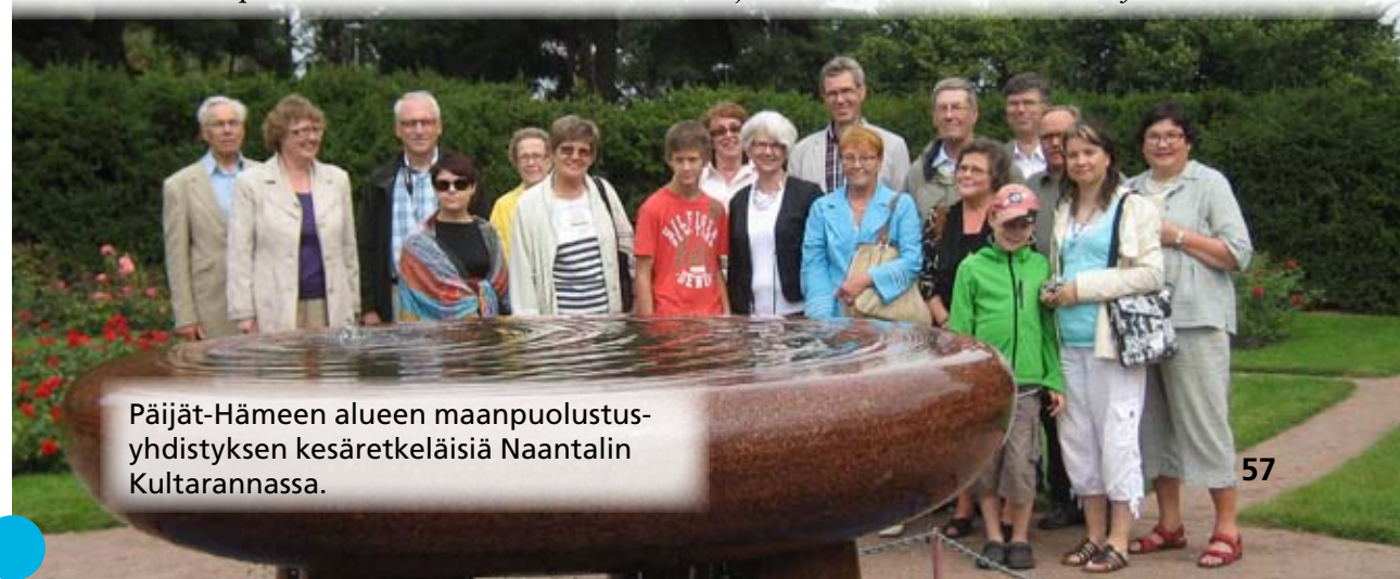
Päijät-Hämeen alueen maanpuolustusyhdistyksen kesäretkeläisiä Naantalin Kultarannassa.