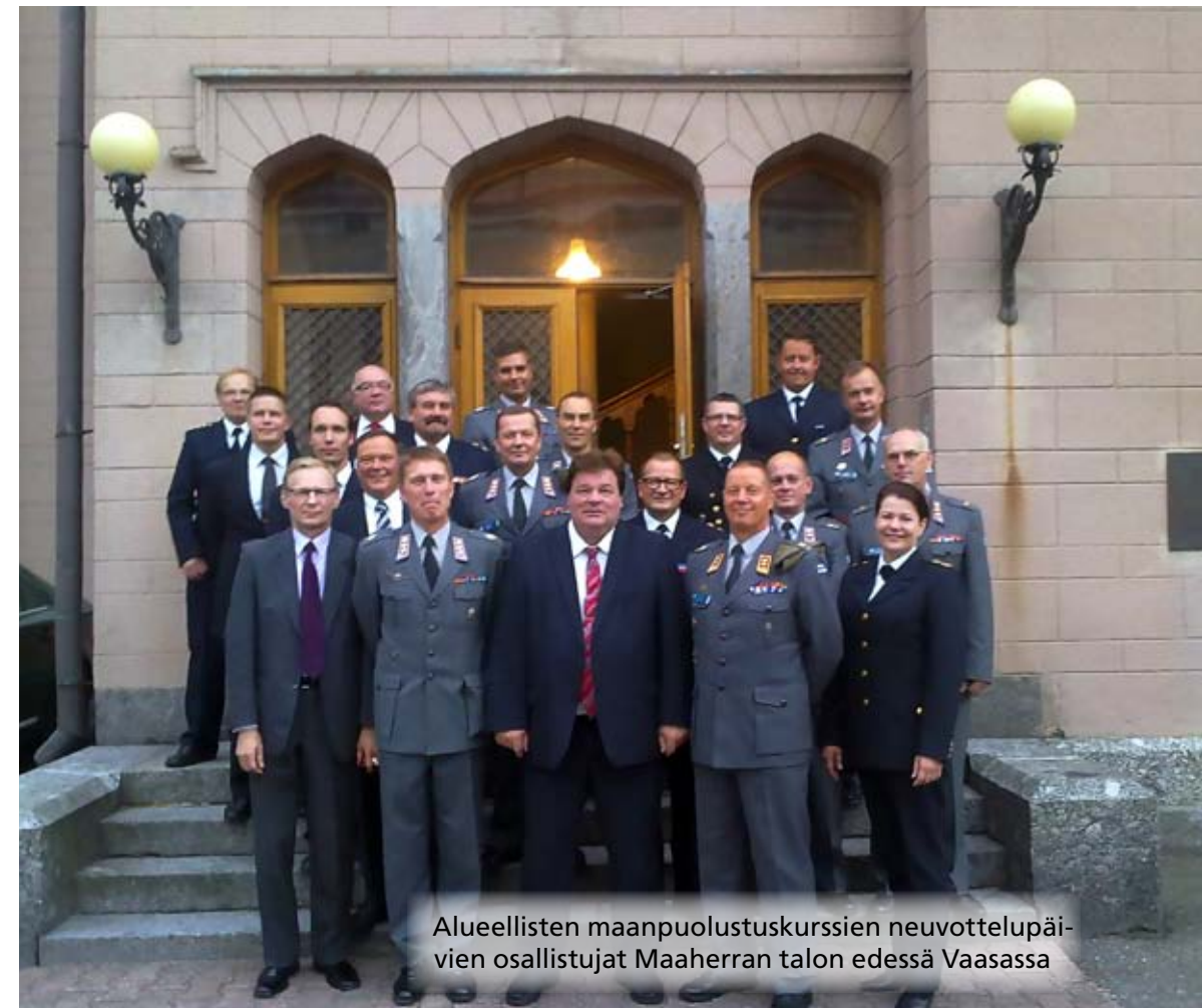
Alueellisten maanpuolustuskurssien neuvottelupäivien osallistajat Maaherran talon edessä Vaasassa

Neuvottelupäivillä kuultiin ajankohtaiset esitykset alueellisten maanpuolustuskurssien toiminnasta sekä suunniteltiin niiden tulevaa toimintaa.