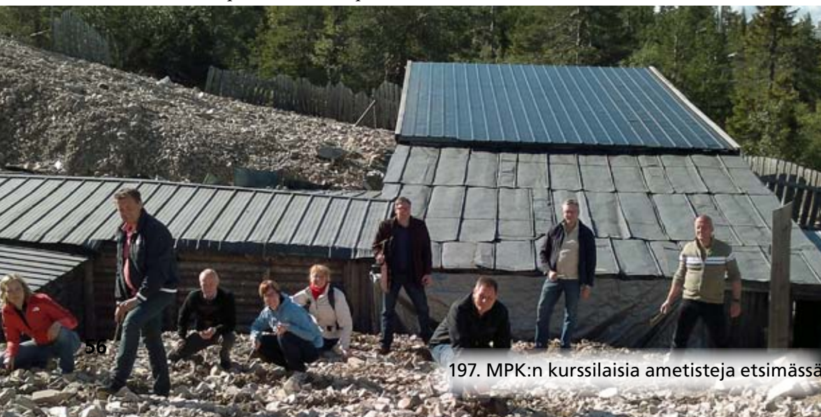
197. MPK:n kurssilaisia ametisteja etsimässä