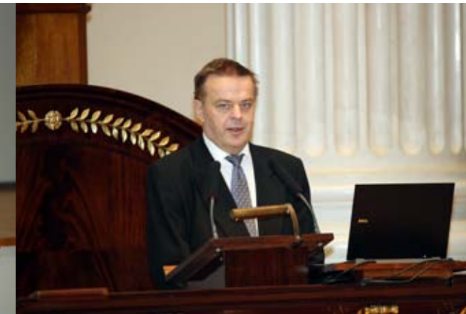
Valtiosihteeri Raimo Sailas alusti aiheesta ”Talouden näkymät”