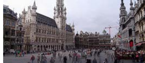
Grand Place keskusaukio