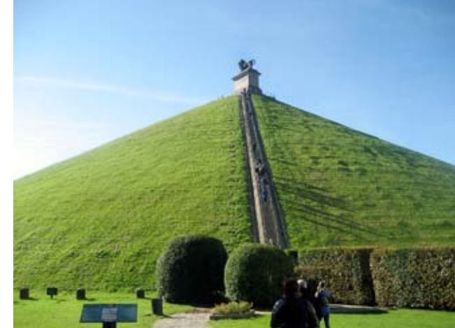
The Lion Mound

Nato on YK:n peruskirjaan nojaava puolustusliitto, johon kuuluu 28 jäsenmaata, niistä 21 EU:n jäseniä. Korkein päättävä elin on Pohjois-Atlantin neuvosto, joka kokoontuu pääministeri- tai lähettilästasolla ja päätökset tehdään konsensus-periaatteella. Jos jäsen ei voi yhtyä esitettyyn ratkaisuun, se voi harkita rakentavaa pidättymistä tai olla osallistumatta päätöksen perusteella käynnistettävään toimintaan (esim. Saksa Libyan suojeluoperaation