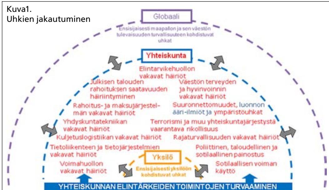
Kuva1. Uhkien jakautuminen

yhteiskunnan kokonaisturvallisuudelle. Uhan kohteita kansainvälisissä arvioissa ovat