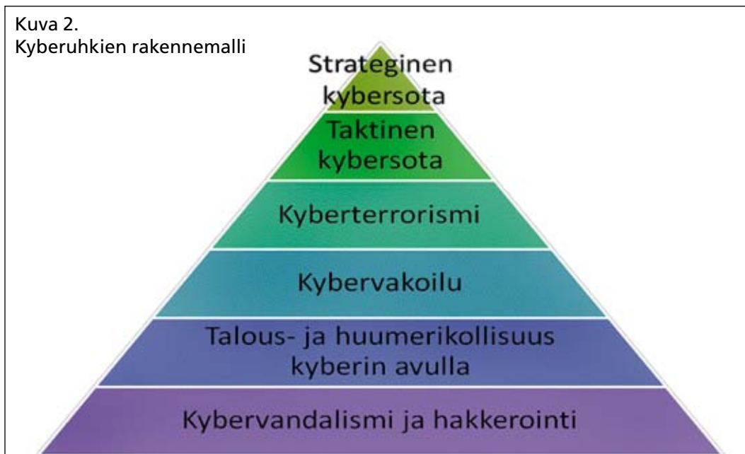
Kuva 2. Kyberuhkien rakennemalli