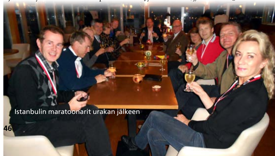
Istanbulin maratoonarit urakan jälkeen