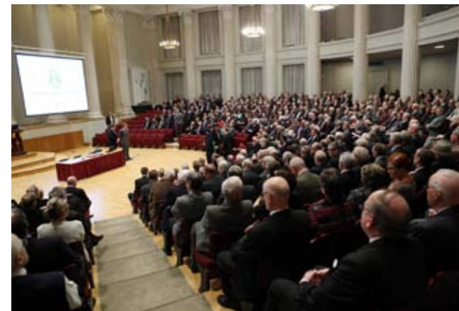
Helsingin Yliopiston juhlasalissa oli noin 650 henkilöä kuulemassa ajankohtaista esitystä